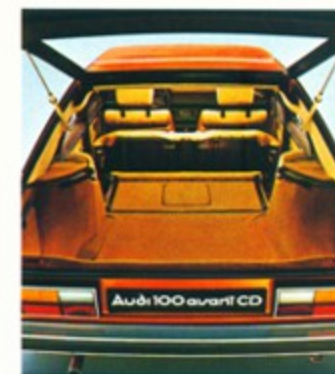
Mit umgeklappter Rückbank hat der Gepäckraum eine großzügige Ladefläche von 2 qm.

Die umgeklappte Rück-sitzbank sitzt in einer festen Verankerung. Die gesamte Lade-fläche ist mit Teppich ausgelegt.