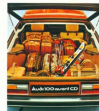
Auf der 1,60 m tiefen Ladefläche können Sie auch sperriges Ski-Gepäck unterbringen.